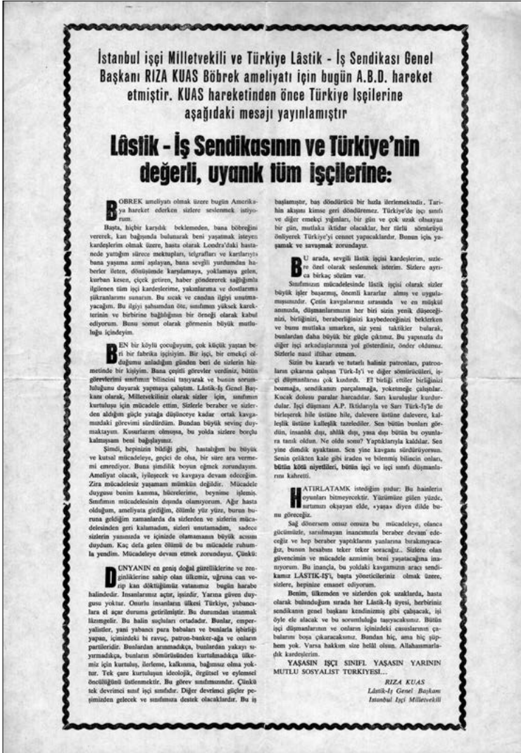
▼ Rıza Kuas'ın işçilere mesajı, TUSTAV DİSK Arşivi.

İstanbul işçi Milletvekili ve Türkiye Lastik - İş Sendikası Genel Başkanı RIZA KUAS Böbrek ameliyatı için bugün A.B.D. hareket etmiştir. KUAS hareketinden önce Türkiye İşçilerine aşağıdaki mesajı yayınlamıştır